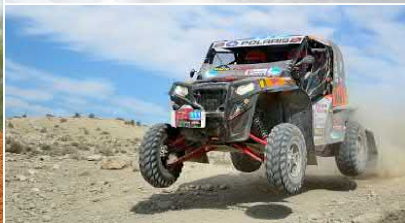
Таблица подбора моторных масел ADDINOL для мототехники