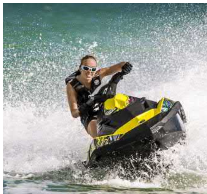
Таблица подбора масла для водной техники Выберите марку > Выберите допуск > Выберите продукт ADDINOL